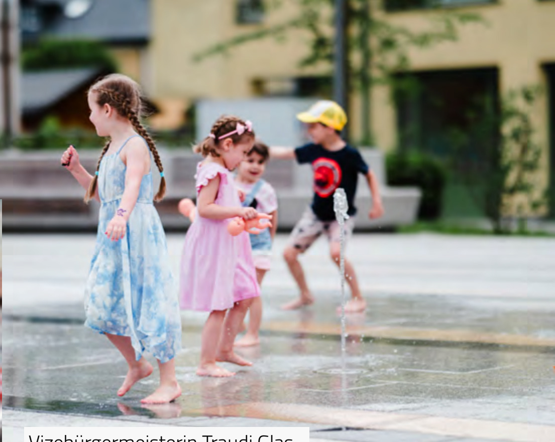
Vizebürgermeisterin Traudi Glas