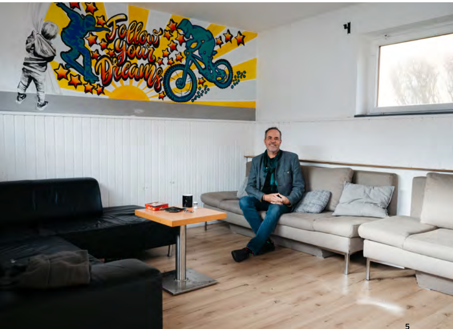
Raum für die Jugend schaffen - sowohl im Ort als auch im Goiserer Jugendraum