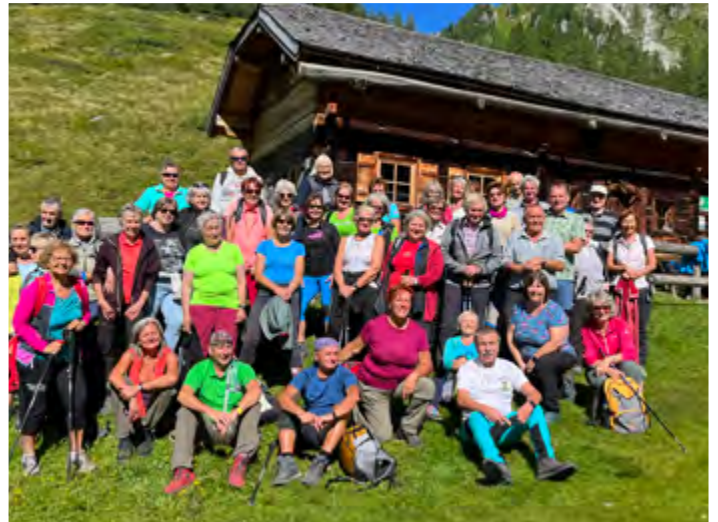
Der Pensionistenverband bei der Wanderung zur Ursprungalm