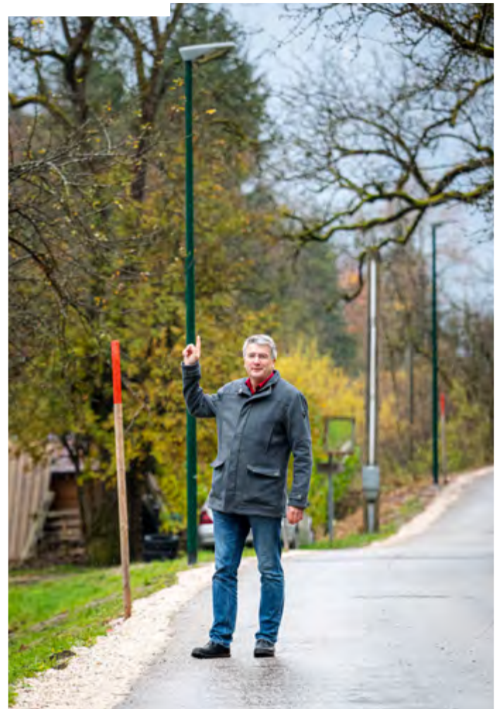
Umstellung auf LED Straßenbeleuchtung

„Der Einsatz für die Bereiche Energie, Klimaschutz und Mobilität ist mir ein Herzensanliegen. Wir können stolz und froh sein, dass hier viel weitergegangen ist und werden diesen Weg die kommenden Jahre fortsetzen.“