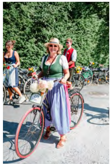
Teilnahme bei der diesjährigen Radlpirsch