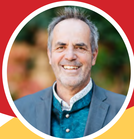
Leopold Schilcher Bürgermeister