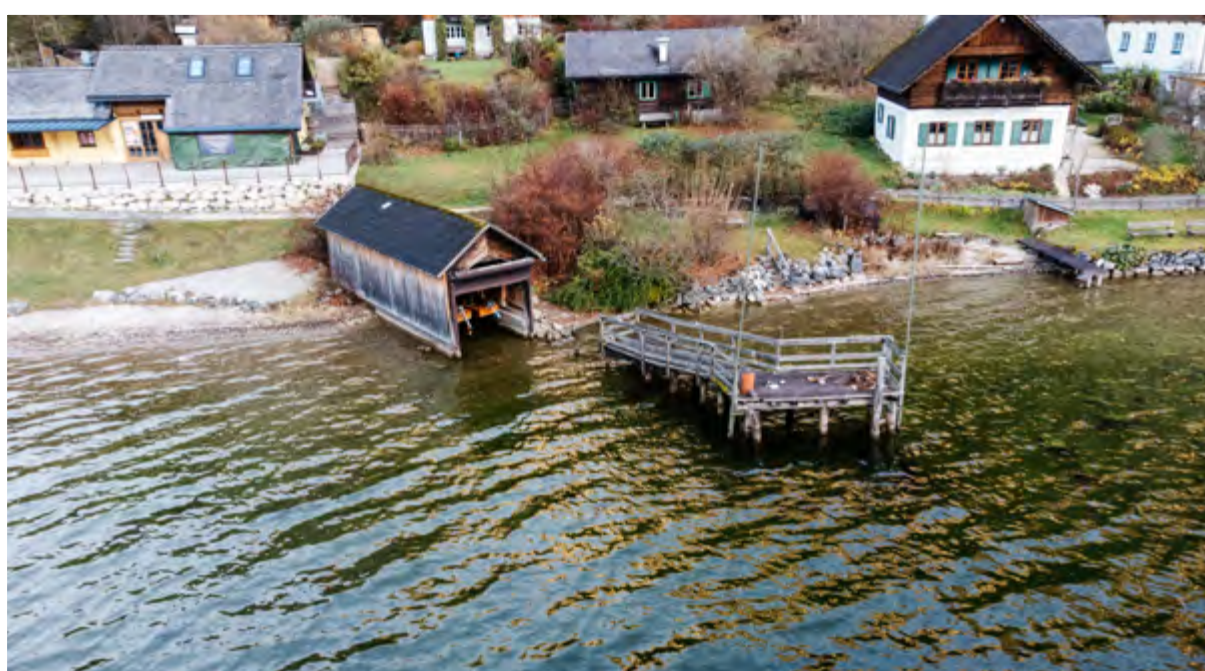
Errichtung neuer Steganlagen in der Seeraunzn und Gosaumühle