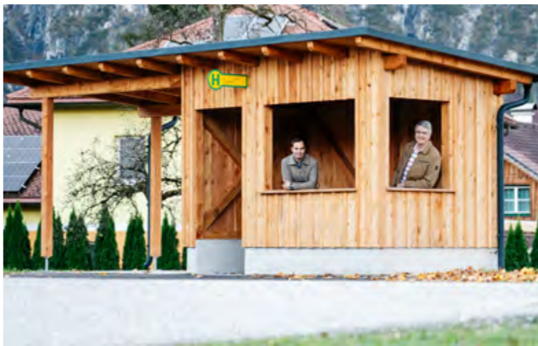
Das alte Buswartehäuschen in Au wurde gegen ein neues „Musterbushütterl“ mit geschützter Sitzgelegenheit und Fahrradständern getauscht.