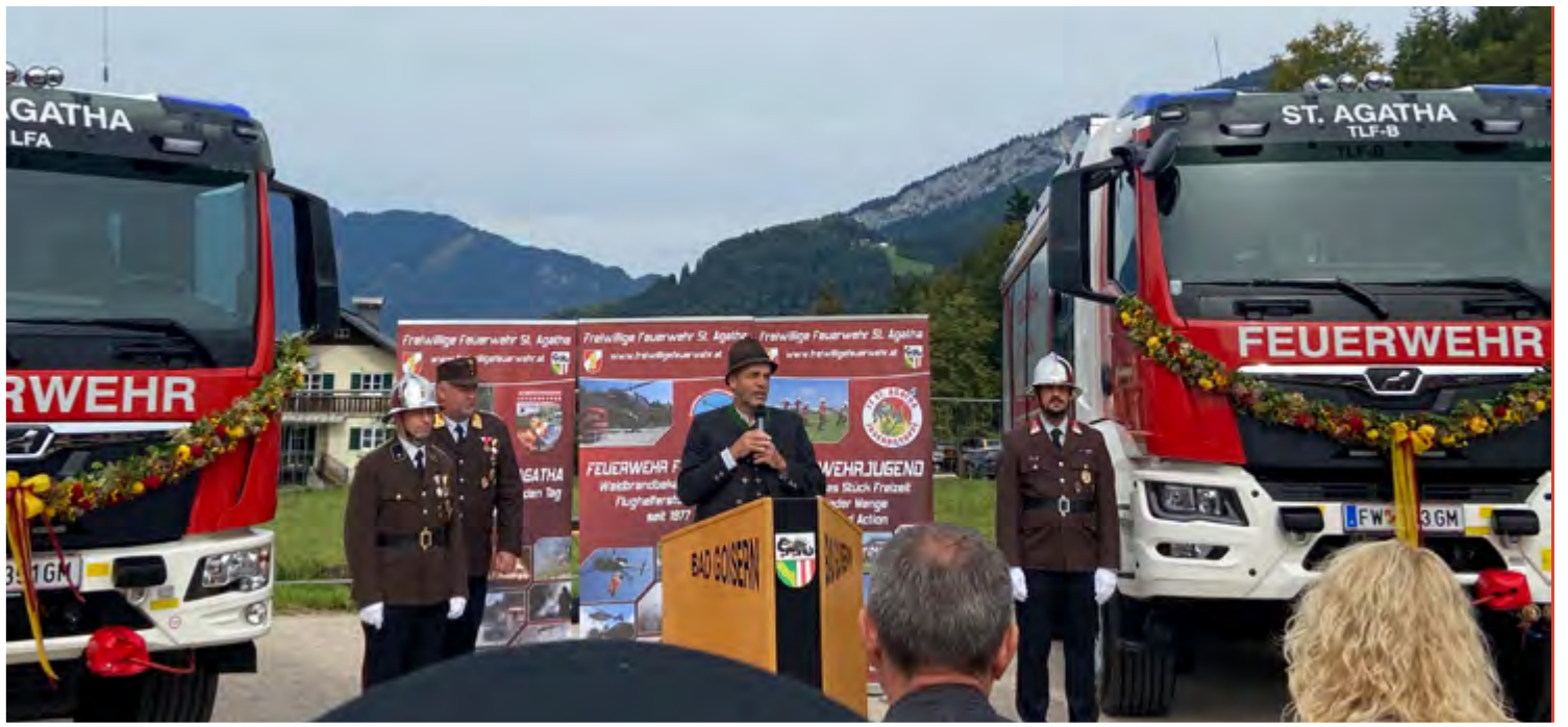
Für mehr Sicherheit - neue Feuerwehrfahrzeuge für die FF Bad Goisern und die FF St. Agatha