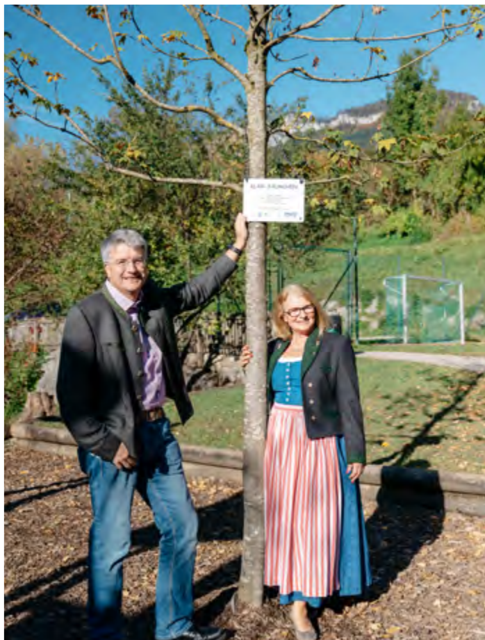
Neue, schattenspendende Bäume für unsere Kleinsten