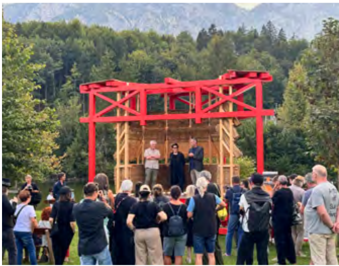
Eröffnung Analog Festival im Rahmen der Kulturhauptstadt