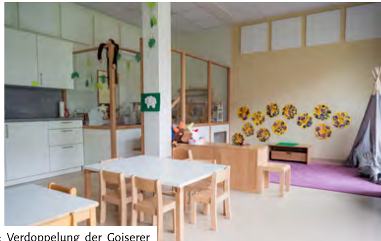
Beste Bildung von Klein auf: Verdoppelung der Goiserer Krabbelstubenplätze mit neuen Räumlichkeiten im Stampfl