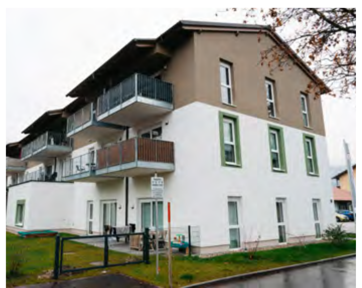
Leistbares Wohnen im Stampfl und in der Schrempfgasse