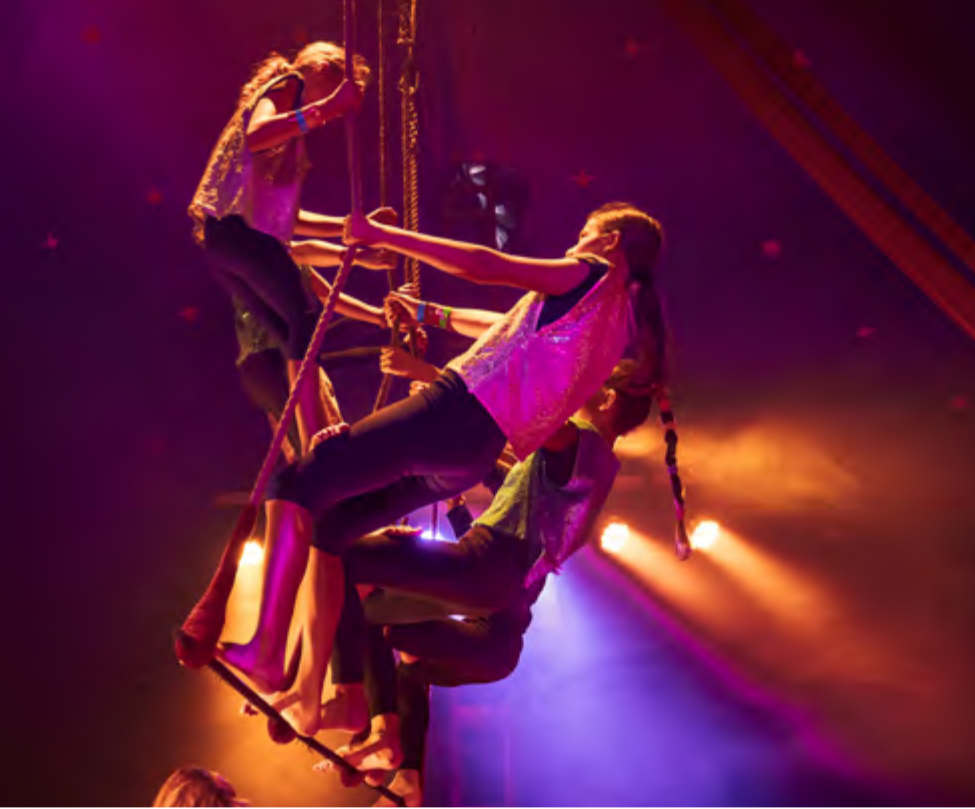
Goisern macht Zirkus