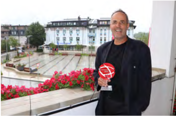
Bad Goisern erhält OÖ Ortsbildpreis für das Traunviertel