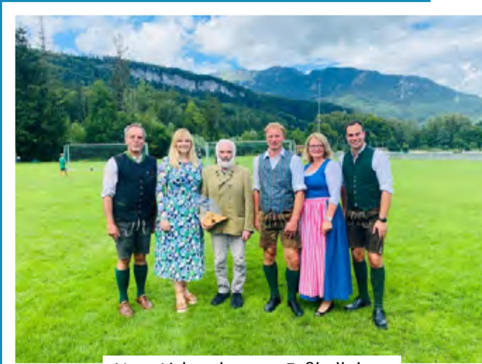
Neue Lichanlage am Fußballplatz.