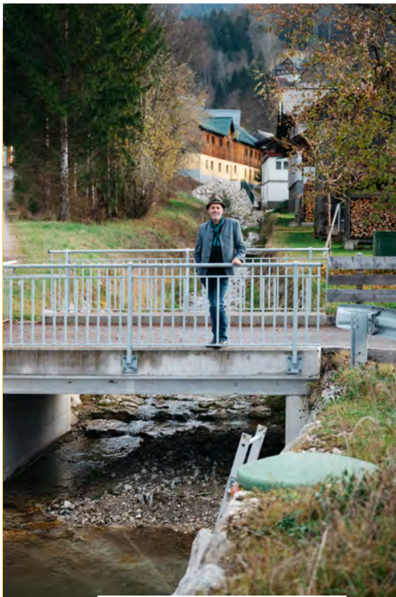
Neue Schutzmaßnahmen beim Pötschenbach